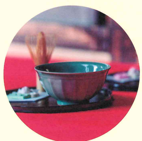
武家屋敷安間家史料館